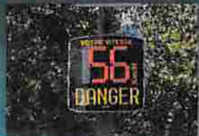
Implantation de radars pédagogiques Page 4