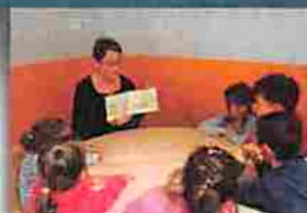
Le label "Ma commune aime lire et faire lire" Page 7