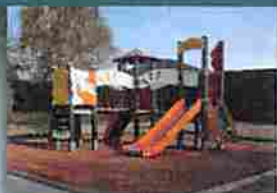
Ecoles publiques : de nouveaux jeux Page 7